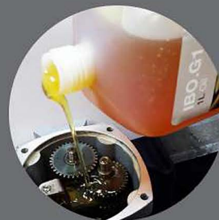
Редуктор с масляной ванной