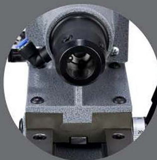
Монолитное исполнение корпуса редуктора и салазок